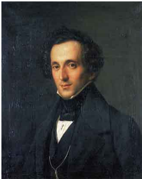
Felix Mendelssohn Bartholdy 1809 - 1847