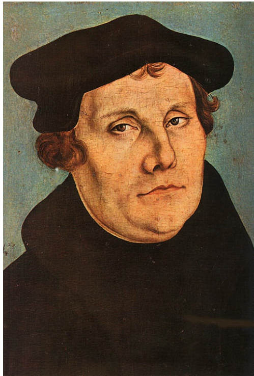
Martin Luther 1483 - 1546 Porträt von Lucas Cranach