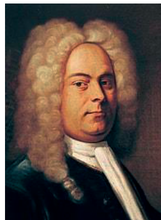
Georg Friedrich Händel 1685-1759

Gutshaus Steglitz, Schloßstraße 48 Schwartzsche Villa, Grunewaldstraße 55 S + U Bahn Rathaus Steglitz Heimatverein „Steglitz-Museum“, Drakestr. 64a Bus M11, Haltestelle Holbeinstraße