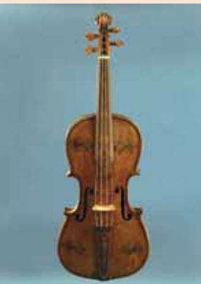
Alemanische Schule Violine, Joseph Meyer zugeschrieben Geroldshofstetten bei Grafenhausen, 3. Viertel 17. Jahrhundert

Eine lokal begrenzte, aber bedeutende Geigenbautradition stellt die Alemannische Schule dar, die im 17. Jahrhundert im Südschwarzwald (Werkstätten Joseph Meyer und Frantz Straub) und in der Schweiz im Raum Bern (Werkstatt Hans Krouchdaler) bestand. Ihre reich verzierten Instrumente dokumentieren eine Bauweise, die von Polen bis England reichte und teilweise bis ins frühe 20. Jahrhundert galt. Die Instrumente wurden im Unterschied zu den Geigen der Cremonenser Meister ohne stützende Innenform gebaut; der Zargenkranz wurde frei auf den Boden aufgesetzt. Das Musikinstrumenten-Museum zählt sieben Instrumente und Instrumentenfragmente der Alemannischen Schule zu seinem Bestand.