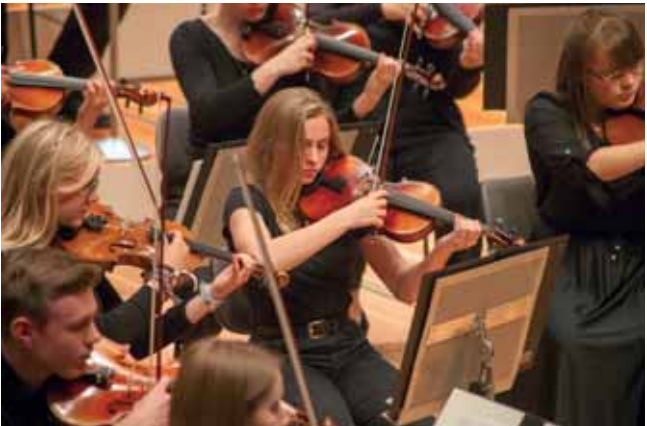
Violin-Schülerinnen und -schüler der Leo-Borchard-Musikschule im Konzert