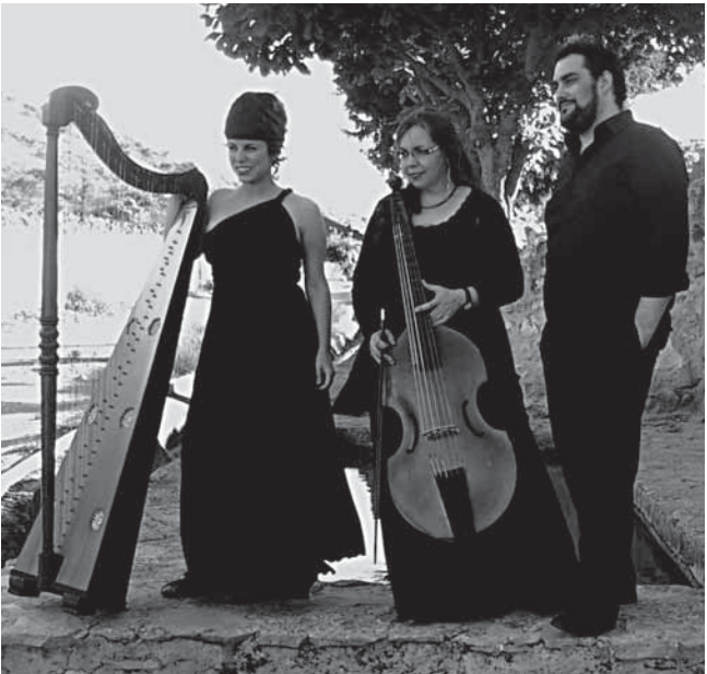
Luz y Norte

Tickets: 030 - 2548 1178 oder unter kasse@mimpk.de