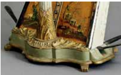
Detail einer Einfachpedalharfe von Cousineau Père & Fils, gebaut in Paris um 1785, aus dem Bestand des Musikinstrumenten-Museums

Tickets: 030 - 2548 1178 oder unter kasse@mimpk.de