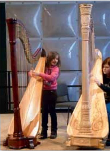
Tag der Harfe